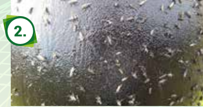
Eine hängende Bremsenfalle - Ball mit Sticky Bremsenfallenleim