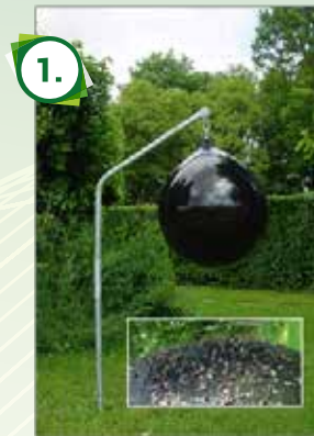
Die Loer Leimfalle